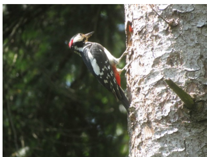
Buntspecht baut Höhlen